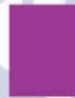
31L00052 Fiusha Fucsia