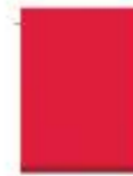
31L00054 Rojo Beta Beta Red

Usos Recomendados/Recommended uses Sombrillas Publicitarias / Advertising Umbrellas Colchonetas / Mattresses Cortinas Avícolas/poultry curtains etc.