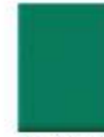
31L00077 Verde Bandera Flag Green