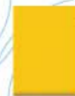
31L00035 Amarillo Normal Yellow