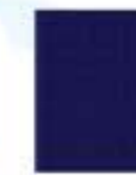
31L00068 Azul Marino Navy Blue