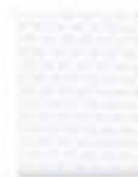
31L00005 Blanco brillante p /impresión AR 40/40 Bright White for print