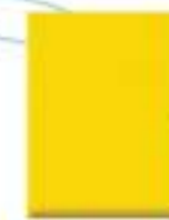
31L00033 Amarillo Especial Special Yellow