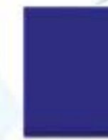
31L00066 Azul PEP PEP Blue