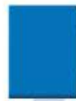
31L00067 Azul Rey Royal Blue