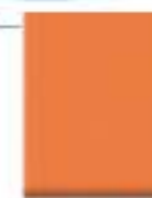
31L00041 Naranja Orange