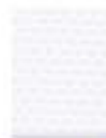
31L00002 Blanco Brillante Bright White