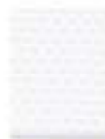
31L00001 Blanco Mate Matte White