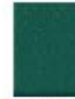
31L00078 Verde Botella Dark Green