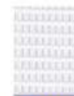
31L00060 Transparente Traslucid