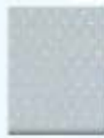
31L00082 Gris Plata Silver