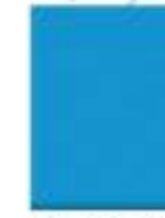
31L00061 Azul Claro Light Blue