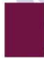
31L00057 Vino Wine