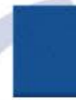
31L00069 Azul Fuerte Dark Blue