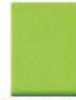
31L00073 Verde Limón Lemmon green