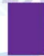
31L00062 Morado Purple